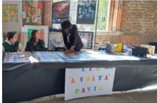
Exhibit realizzato dall'I.I.S. "A. Volta"

All'ombra offerta dai portici del Castello Visconteo, i tanti studenti dei più disparati istituti del pavese, nell'ambito di Scienza Under18, hanno intavolato un atipico confronto tra realtà differenti, tra percorsi di studi distanti, tra scuole di gradi diversi, tutti accomunati dall'amore per la scienza, in tutte le sue forme ed applicazioni.