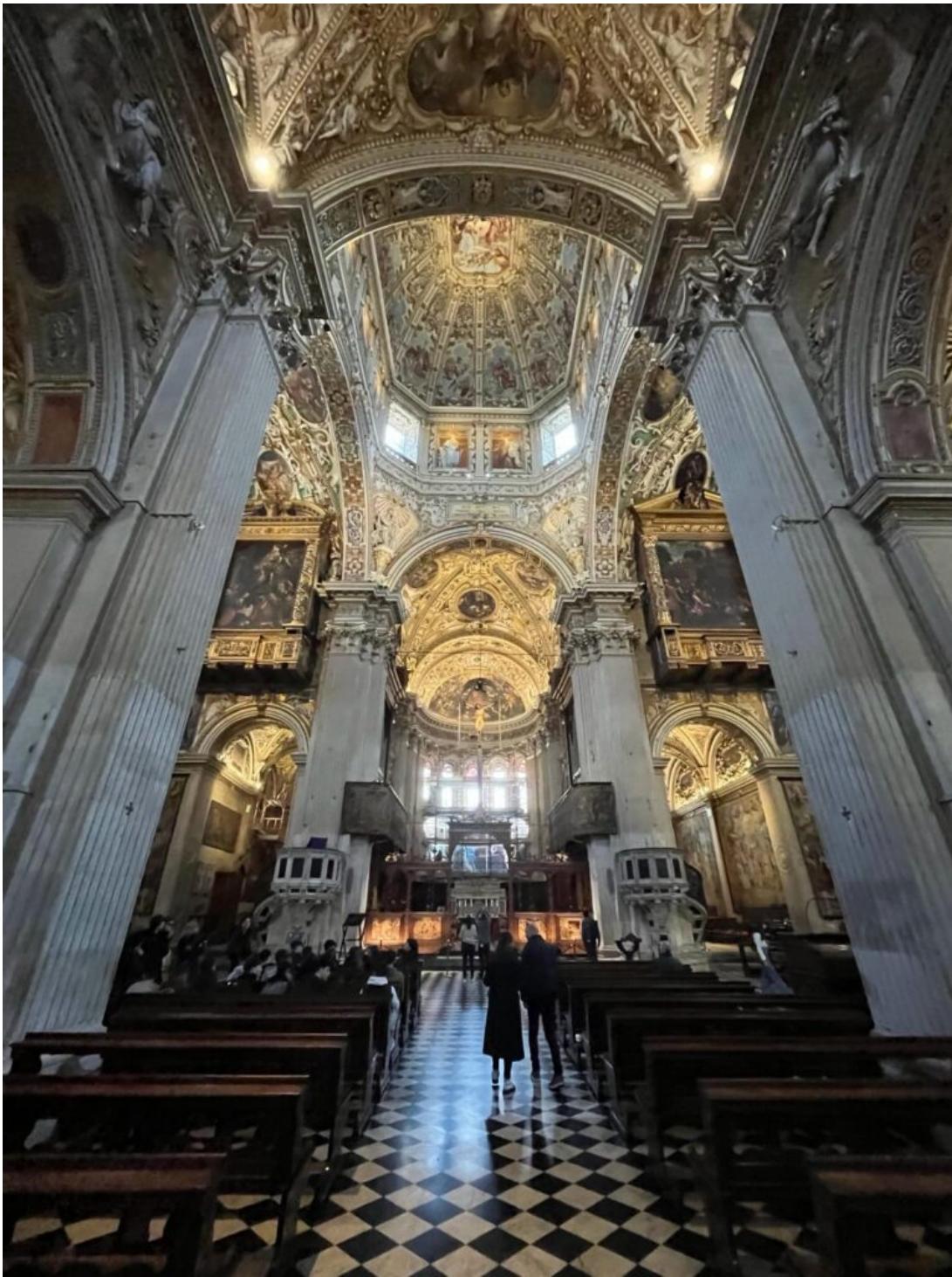
Interno della Basilica di Santa Maria Maggiore

Alessandro Bianchi, Arturo Bolognesi e Pietro Coccia 1DLS