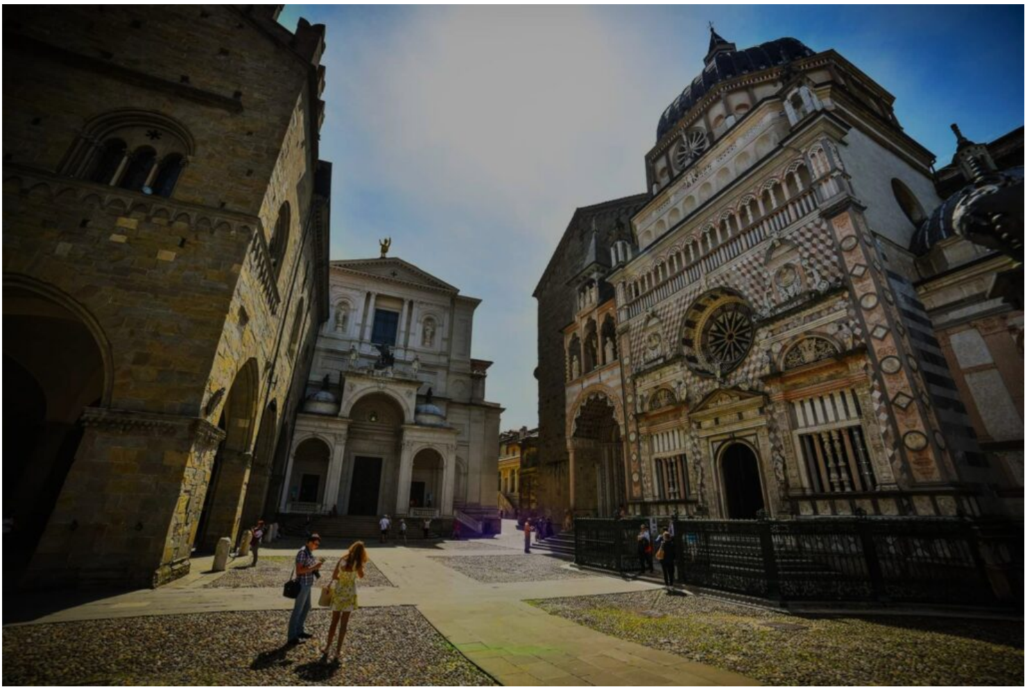
Piazza del Duomo: Tomba Colleoni, Basilica Santa Maria Maggiore, Duomo e Palazzo della Regione