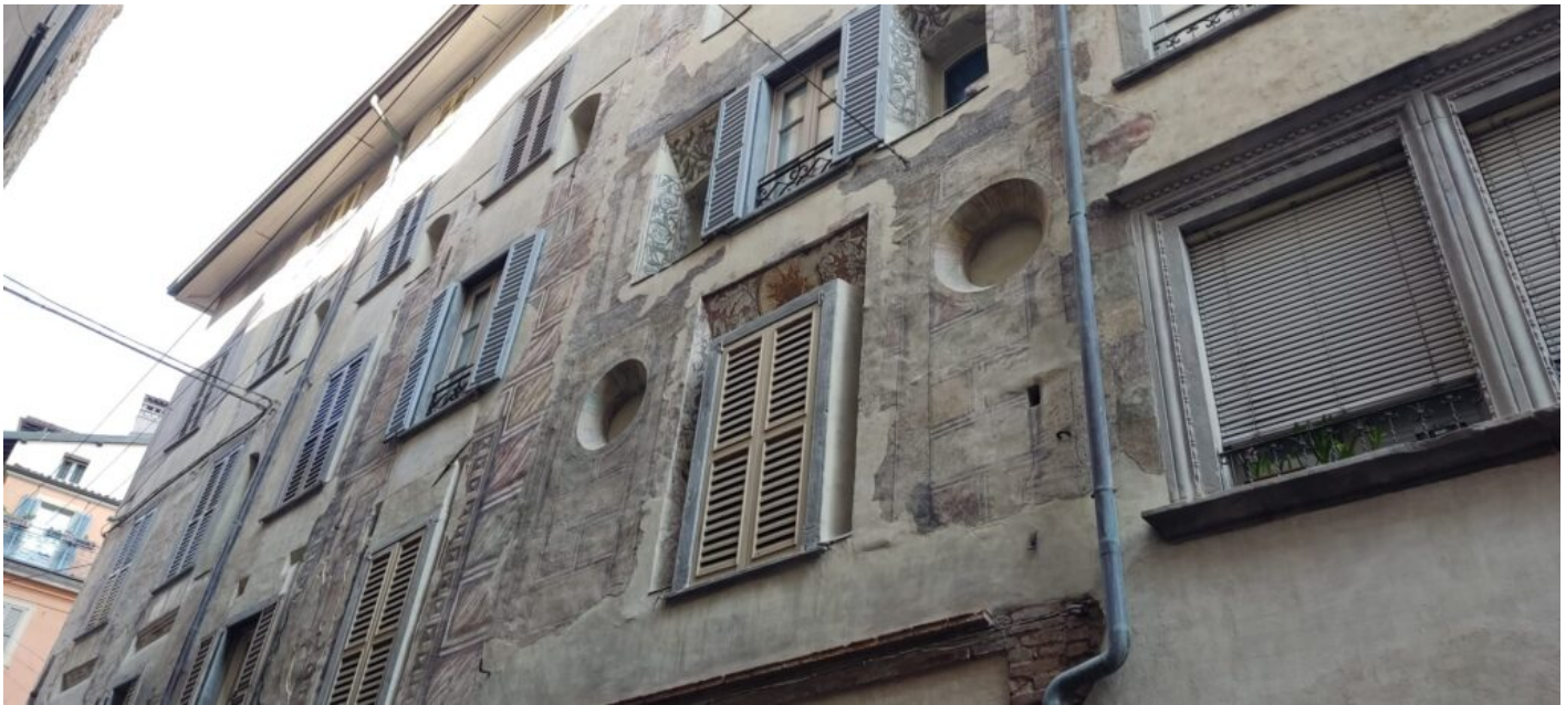
Affreschi, parzialmente rovinati, sulle case

Tappa successiva la Piazza del Duomo che ha dato inizio alla seconda parte della gita. Piazza del Duomo, considerata la piazza principale, ha diversi monumenti importanti: la Basilica di Santa Maria Maggiore, la Tomba del Colleoni, il Palazzo della Regione, il Battistero e il Duomo.