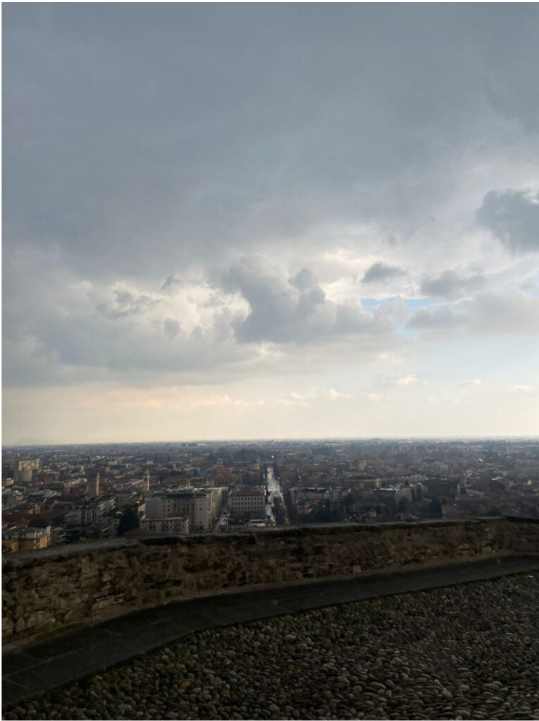
Veduta di Bergamo dalla Città Alta