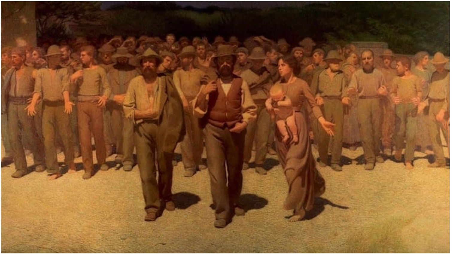
“Il Quarto Stato”, 1901, Giuseppe Pellizza da Volpedo (1868-1907), Olio su tela, 293x545cm

“Il Quarto Stato” è uno dei dipinti più iconici del pittore italiano Giuseppe Pellizza da Volpedo. Rappresenta uno dei capolavori del movimento divisionista italiano, caratterizzato dall’uso innovativo della tecnica pittorica basata sulla divisione del colore in piccoli punti, in anticipazione dell’Impressionismo.