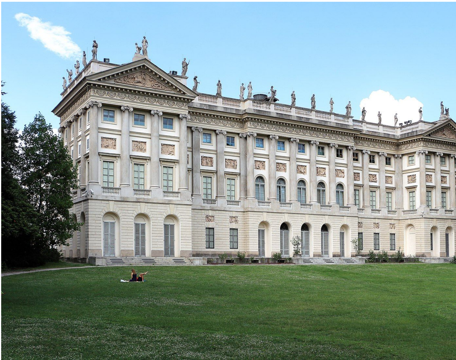
Facciata posteriore di Villa Reale

Concentrandoci sulla struttura dell'edificio con pianta ad U, esso è costituito da un corpo principale e due ali più basse ad esso perpendicolari che racchiudono il cortile d'onore affacciato sulla strada da dove potevano accedere le carrozze. Verso il giardino si dispiega invece un'ampia fronte orizzontale, dove si affacciano gli ambienti più importanti del palazzo. L'andamento orizzontale è invece prevalente nella Fronte sul parco. L'armonia e la razionalità vi dominano attraverso la ritmata successione degli elementi che la costituiscono: gli archi al piano terreno aperti nell'alto zoccolo a bugnato, le semicolonne alternate alle finestre e agli altorilievi al piano nobile, le decorazioni sull'alto fregio, le statue che sormontano la balaustra. Su via Palestro si affaccia il lungo muro di cinta, decorato a bugnato, interrotto dalle facciate delle due ali laterali, di soli due piani. Attraverso tre archi, che si aprono sotto un colonnato ionico, si accede alla corte d'onore. I tre archi del muro esterno si ripetono su tutti i quattro lati della corte, conferendole simmetria e unitarietà. Nel corpo centrale sono sovrastati da quattro colonne ioniche che proseguono visivamente nelle quattro sculture elevate sopra balaustra, con un effetto di solenne verticalità.