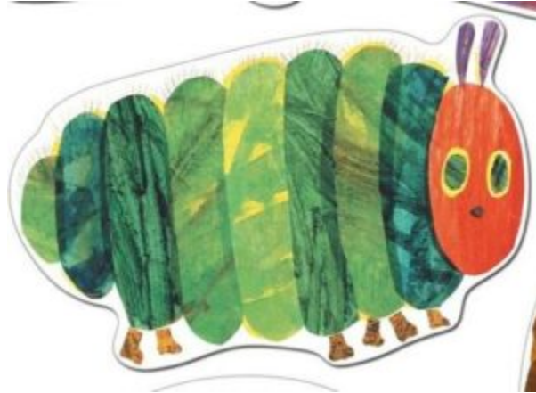
Exhibit realizzato dalla pluriclasse dell'Istituto Dosso Verde di Pavia

Allo stand della scuola Dosso Verde di Pavia, alcuni bambini ci hanno mostrato degli esperimenti che hanno realizzato con l'aiuto dei loro maestri.