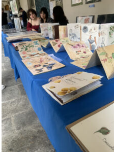
Exhibit realizzato dalle classi seconde, terze e quarte dell' I.I.S. "A. Volta"

Nello stand organizzato dalle classi del liceo artistico, si possono ammirare dei bellissimi disegni prettamente improntati su temi scientifici che illustrano parti anatomiche del corpo umano, piante e rivisitazioni di quadri naturalistici di artisti famosi.